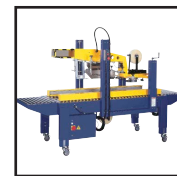
CT 108 SDF

Technische wijzigingen voorbehouden Versie 10/ 2014