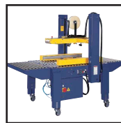
CT 105 SDR